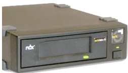
actiDisk RDX® USB 3.0 extern professional Externes Beistellgerät mit eingebautem USB 3.0 RDX®-Laufwerk

Die Geräte der actiDisk Professional Line werden einfach über ein oder zwei externe USB 3.0 Schnittstellen an Windows- oder Linux-Server angeschlossen und betrieben. Die RDX®-Medien werden von den Servern als auswechselbare Festplatten erkannt. Auch der Einsatz als Backup, Archiv oder Wiederherstellungsmedium mit einer Backup-Software inklusive Folge-Media-Management, Katalog- und Archiv-Verwaltung ist möglich.