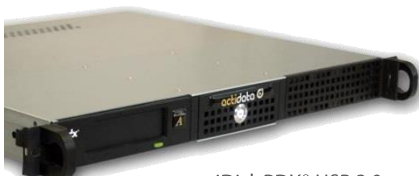
actiDisk RDX® USB 3.0 extern professional 1U Rackmount-Gerät mit einem eingebautem USB 3.0 RDX®-Laufwerk