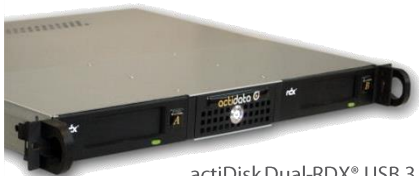
actiDisk Dual-RDX® USB 3.0 extern professional 1U Rackmount-Gerät mit zwei eingebauten USB 3.0 RDX®-Laufwerken und zwei separaten USB 3.0 Schnittstellen